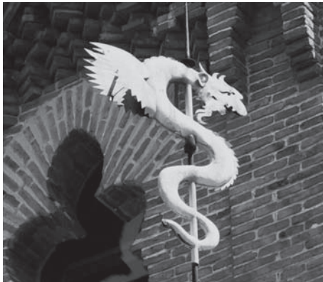
Fig. 4: Dragón de forja Art Decó que remata el tejado del Palacio Laredo.

época. Así resultaba una especie de ambientación del Paseo de la Estación tal como sería al poco tiempo de construirse el Palacio Laredo. Pero quedaba una sorpresa para el final. El último dibujo que extraía el cuentacuentos de su carpeta era un dragón surcando los cielos. ¿Qué hacía allí un dragón? El cuentacuentos les decía a los niños que, efectivamente, hace muchos años había venido a Alcalá un dragón que se había posado sobre el tejado del Palacio Laredo, y desde entonces se había quedado dormido y no se había vuelto a despertar. Acto seguido los monitores enseñaban a los niños el lugar donde se encontraba el dragón y les aconsejaban que guardasen silencio y se portaran bien si no querían despertarlo mientras visitaban el palacio. El dragón, en realidad, es un remate escultórico de estilo Art Decó , hecho de forja, que adorna todavía hoy el Palacio Laredo pero, en aquellos momentos, la imaginación de los niños se desbordaba.