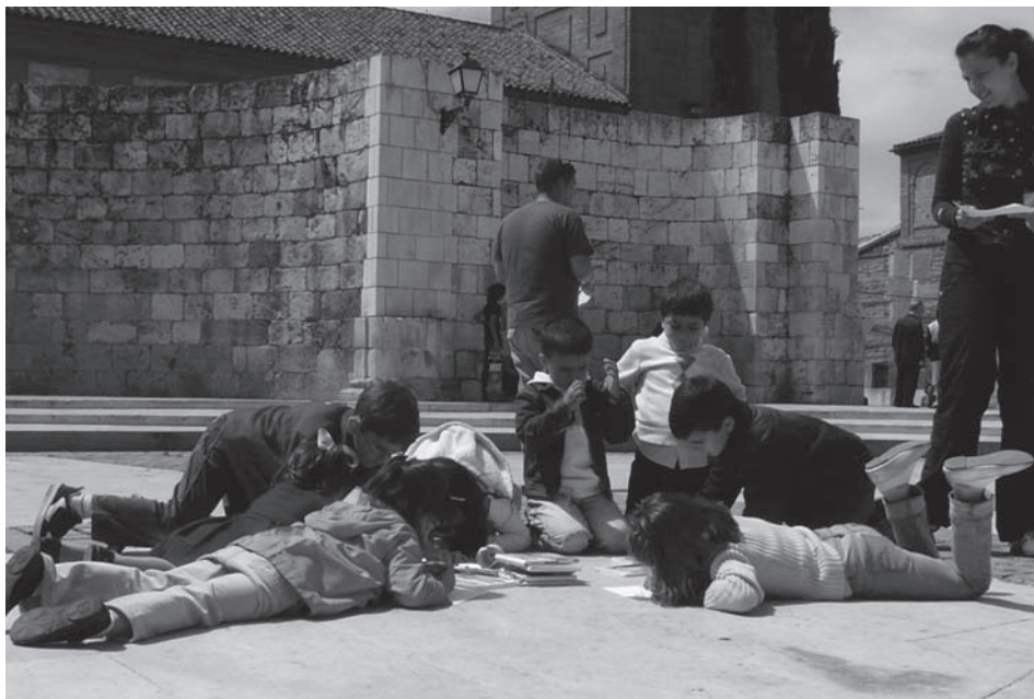
Fig. 7: Resolviendo el misterio de las ruinas de la iglesia de Santa María (mayo 2008).

reconstruir el puzle, podía leerse el texto de la partida de bautismo de Cervantes y, de esta forma, los monitores explicábamos el significado del sitio en el que nos encontrábamos. Como complemento a la explicación, repartimos a los niños un croquis y los guiamos por en medio de las ruinas, con el fin de ayudarles a comprender qué era cada uno de los elementos que se conservaban: los ábsides de la iglesia, los pilares que sostenían las bóvedas, la torre, la sacristía y las capillas laterales, en una de las cuales se halla la pila bautismal de Cervantes. A pesar de tratarse de un espacio arquitectónico cuya apreciación podía resultar un tanto abstracta, por su alto nivel de degradación, la verdad es que los destinatarios lograron interpretarlo correctamente.