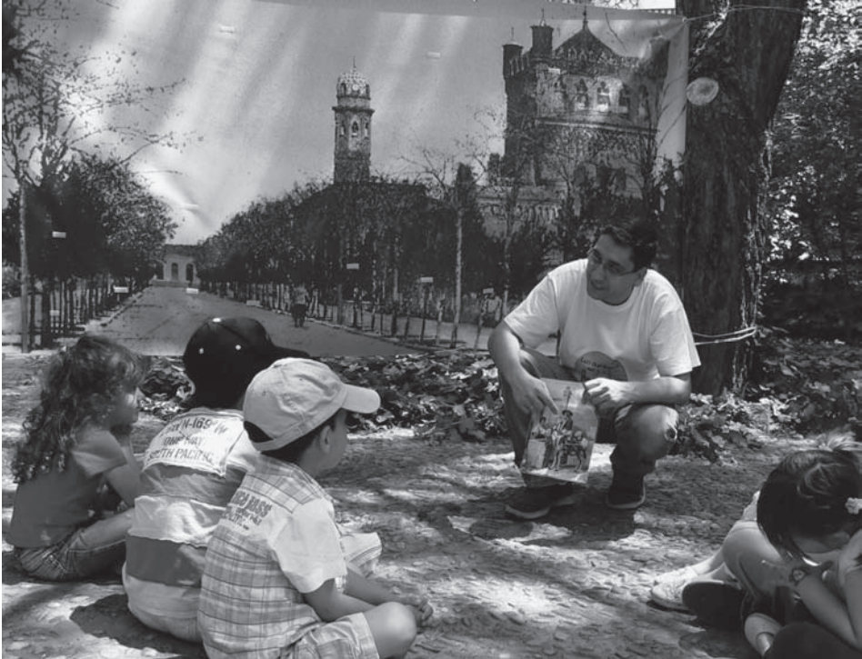
Fig. 2: Cuento-mural en el jardín del Palacio Laredo (junio 2007).

La metodología se basó principalmente en el modelo lúdico. Con el fin de proponer una oferta lo más atractiva posible, se utilizaron recursos didácticos muy diversos que permitieron conectar con un sector más amplio de destinatarios. El modelo de sesión, de una hora aproximada de duración, se iniciaba con algunos juegos cortos o técnicas de animación, para continuar con una actividad principal y finalizar con una actividad de despedida, de carácter plenario, en la que era habitual que participasen también los padres. De todas formas, la programación fue bastante flexible y experimentó algunas modificaciones o incorporó nuevas actividades, en función del tiempo, de la edad de los niños que asistieron cada día, de sus características y de otros factores. A continuación se enumeran los principales grupos de actividades desarrolladas.