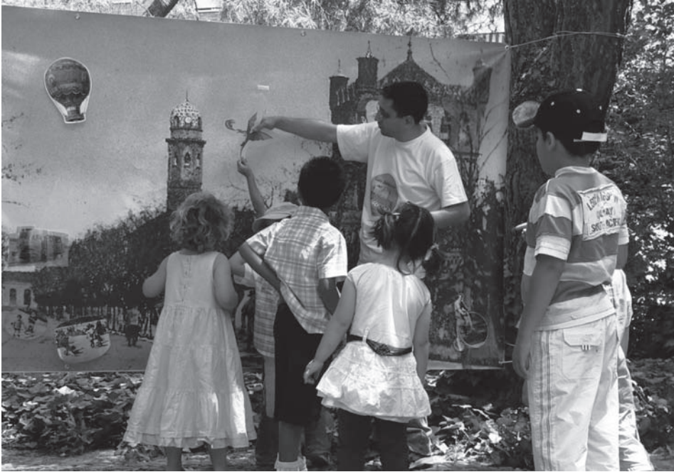
Fig. 3: Cuento-mural en el jardín del Palacio Laredo (junio 2007).

y medio de alto, que mostraba una fotografía del Paseo de la Estación en la época que se construyó el Palacio Laredo. Esta imagen resultaba muy sorprendente para los participantes, no sólo por sus dimensiones sino sobre todo porque el aspecto de esta calle y del propio entorno del palacio ha cambiado mucho desde entonces. Por consiguiente, lo primero que teníamos que hacer era ayudar a interpretar la fotografía comparándola con la realidad actual. Luego un cuentacuentos se presentaba con una carpeta de la que iba extrayendo retratos de personajes y objetos característicos de la sociedad del siglo XIX, por ejemplo un aguador, un soldado de caballería, un sereno, un labrador, un coche de caballos, un velocípedo, una locomotora de ferrocarril a vapor, un globo aerostático, un organillo y varias imágenes de niños jugando a juegos tradicionales como el aro, la carretilla, el caballito de madera, etc. La dinámica consistía en preguntar a los participantes si podían identificar qué o a quién representaba cada imagen, para después aclarar ideas y proponer comparaciones con la realidad actual. Así se intentaba hacer comprender la evolución de las sociedades en el tiempo, los cambios tecnológicos y las diferencias entre las formas de vida de ayer y de hoy.