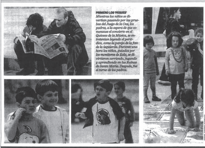
PRIMERO LOS 'PEQUES' Mientras los niños se divertían pasando por las pruebas del Juego de la Oca, los padres, a la espera de que comenzase el concierto en el Quijote de la Música, se entretenían leyendo el periódico, como la pareja de la foto de la izquierda. Durante una hora los niños, guiados por los monitores de Eala, se divertieron corriendo, jugando y aprendiendo en las Ruinas de Santa María. Después, fue el turno de los padres.

» Ayer comenzó el ciclo con un recital de la Banda Sinfónica Complutense. Antes los niños pudieron jugar al 'Juego de la Oca' de la mano de los monitores de Eala