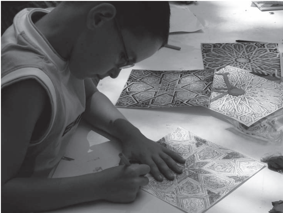
Fig. 6: Taller de azulejos en el jardín del Palacio Laredo (mayo 2007).

yeserías o azulejos, como los que hay en las paredes del palacio. Para los niños fue una forma de contribuir con sus propias manos a la decoración de un edificio tan singular.