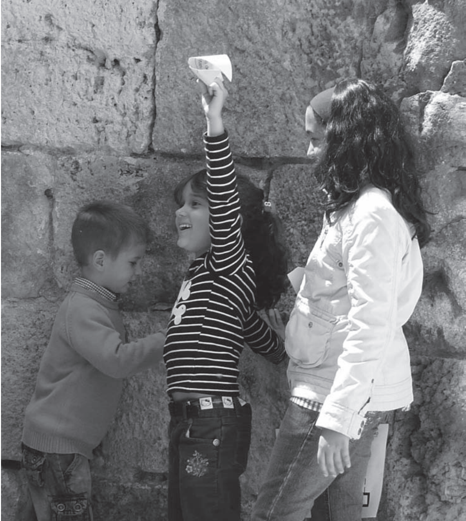
Fig. 8: Buscando fragmentos de la partida de bautismo de Cervantes entre las ruinas de la iglesia de Santa María (mayo 2008).

La actividad se desarrolló en dos partes. En la primera los niños realizaron un taller de fabricación de ratones con bolas de poliespan que pintaron y decoraron, añadiéndoles los detalles de las orejas y el hocico. A continuación pegaron los ratones sobre un enorme pentagrama dibujado en una larga tira de papel continuo, de forma que asemejaban notas musicales. En la segunda parte de la actividad dramatizamos el cuento del flautista con la colaboración de las familias. Éste apareció disfrazado a la