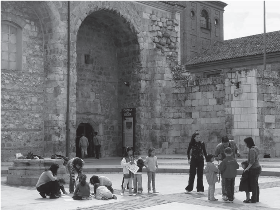
Fig. 1: Juegos en las ruinas de la iglesia de Santa María (mayo 2008).

organizados por instituciones públicas como los ayuntamientos o las administraciones autonómicas, que los subvencionan directamente o externalizan su puesta en práctica, dejándolos en manos de empresas y asociaciones subcontratadas. Así sucede que la duración de los programas es variable, al igual que las actividades que desarrollan, aunque por lo menos se mantienen dos características fundamentales: la primera es que suelen tener una intencionalidad educativa y de difusión cultural explícita, y la segunda es que pretenden promover la participación activa de los destinatarios mediante estrategias típicas de la animación sociocultural y la educación en el tiempo libre.