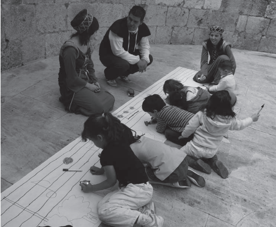
Fig. 10: Actividad relacionada con la música y los cuentos en las ruinas de la iglesia de Santa María (junio 2008).

intencionalidad educativa puede ser una estrategia fundamental para que las nuevas generaciones aprendan a valorar el patrimonio cultural como algo interesante y divertido al mismo tiempo. La buena acogida que las familias dispensaron a las actividades, y el hecho de que muchas personas repitieran su asistencia, son un claro síntoma de que existe una demanda creciente al respecto.