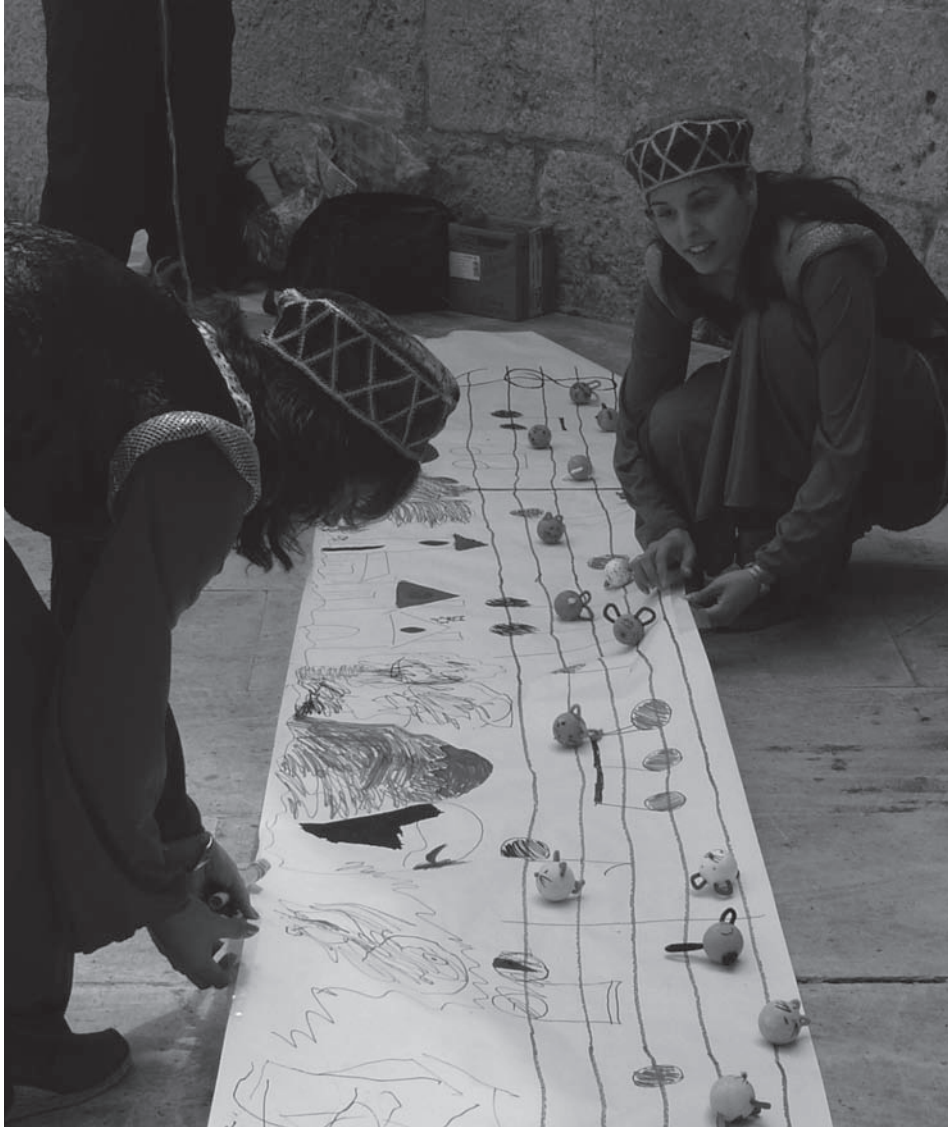
Fig. 11: Actividad relacionada con la música y los cuentos en las ruinas de la iglesia de Santa María (junio 2008).

Por otra parte, hay que reconocer que el impulso otorgado por parte del Ayuntamiento de Alcalá de Henares facilitó enormemente la gestión de ambos proyectos, y que la profesionalidad, creatividad y compromiso por parte de los monitores de EALA garantizaron en todo momento la buena marcha de los mismos.