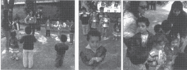
Los niños se aprendieron los nombres de todos con un sencillo juego de presentación y luego fueron a buscar un tesoro

MIENTRAS LOS NIÑOS SE DIVERTÍAN EN EL JARDÍN CON MONITORES, LOS PADRES PUDIERON VISITAR EL PALACIO