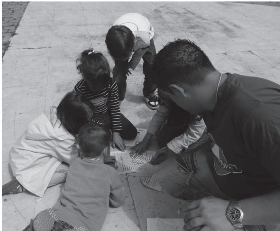
Fig. 9: Reconstruyendo la partida de bautismo de Cervantes en las ruinas de la iglesia de Santa María (mayo 2008).

moda del Renacimiento y se enganchó la tira de papel continuo en el vestido. De esta guisa comenzó a tocar la flauta y a caminar, arrastrando tras de sí la tira de papel con los ratones hasta que desapareció de nuestra vista. Luego regresó y se llevó a los niños, que le siguieron en fila como hipnotizados por la música. Finalmente, los padres pidieron al flautista que les devolviese a sus hijos y, después de mucho negociar, todos se reunieron de nuevo y bailaron una canción de despedida. Tras ello se invitaba a las familias a acudir al concierto de música junto al kiosco de la plaza.