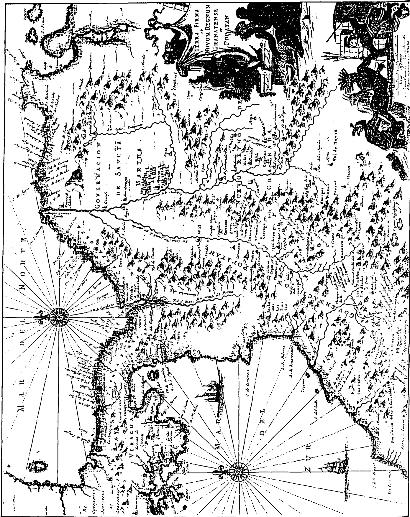
MAPA n° 1.