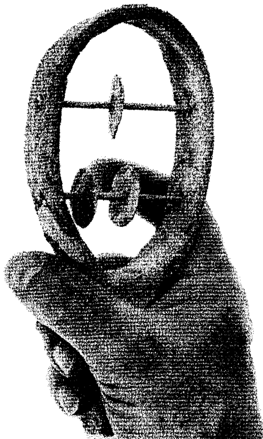
Figura 2: De Y. y E. Sakellarakis, Archanes... , 351, fig. 321