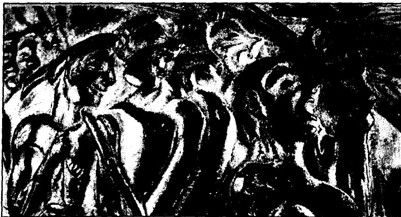
Figura 4: Vaso de los cosechadores. De Y. y E. Sakellarakis, Archanes... , 354, fig. 320

Otro ejemplo de la existencia de este tipo de sistros votivos procede también de Dendera. Se trata de un sistro que perteneció a Apophis, uno de los gobernantes hyksos de la XV dinastía. En un relieve de época tolemaica en Dendera se representa este instrumento con el nombre de Apophis inscrito en un semicartucho, junto con otros sistros. Como ha sugerido Giveon, debía ser un sistro votivo considerado de gran estima, que podría haber sido ofrecido al templo cuando Apophis tenía el control del sur de Egipto 43 . Probablemente el sistro estaba aún en el templo de Dendera cuando el relieve fue realizado, un templo que estaba dedicado a la diosa Hathor, divinidad especialmente asociada a este instrumento.