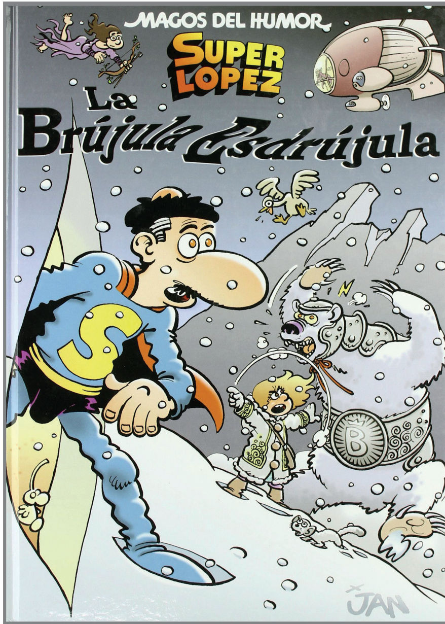
FIG. 8. LÓPEZ, J. Superlópez. La Brújula Esdrújula . © Ediciones B, 2008, portada.

do real de Superlópez, es una obertura hecha hacia un universo que goza de un clima propio de un verano caribeño.