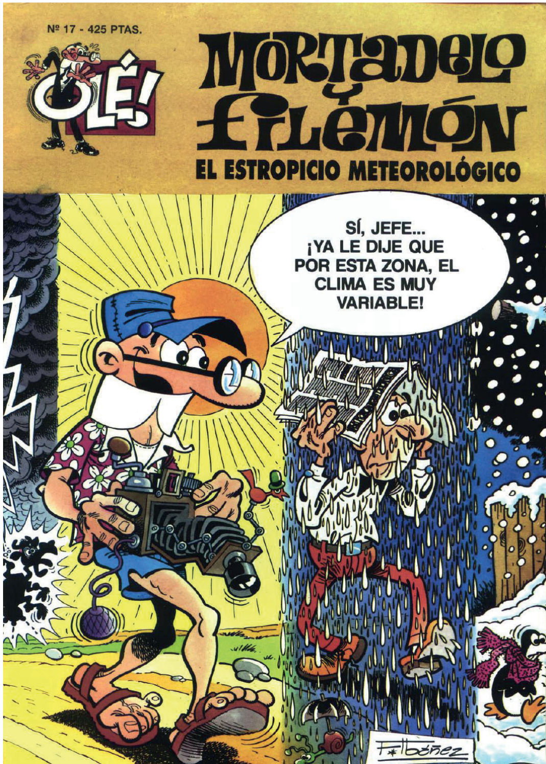
FIG. 6. IBÁÑEZ, F. Mortadelo y Filemón. El estropicio meteorológico. © Ediciones B, 1987, portada.