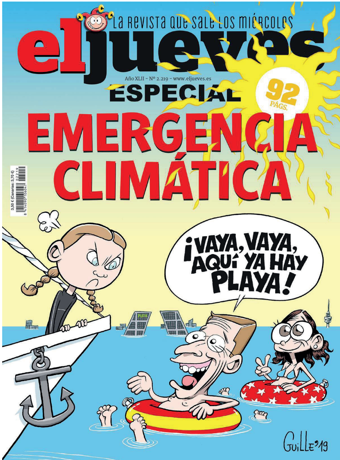
FIG. 4. El Jueves. Especial Emergencia climática , n.º 2219, 2019, portada.