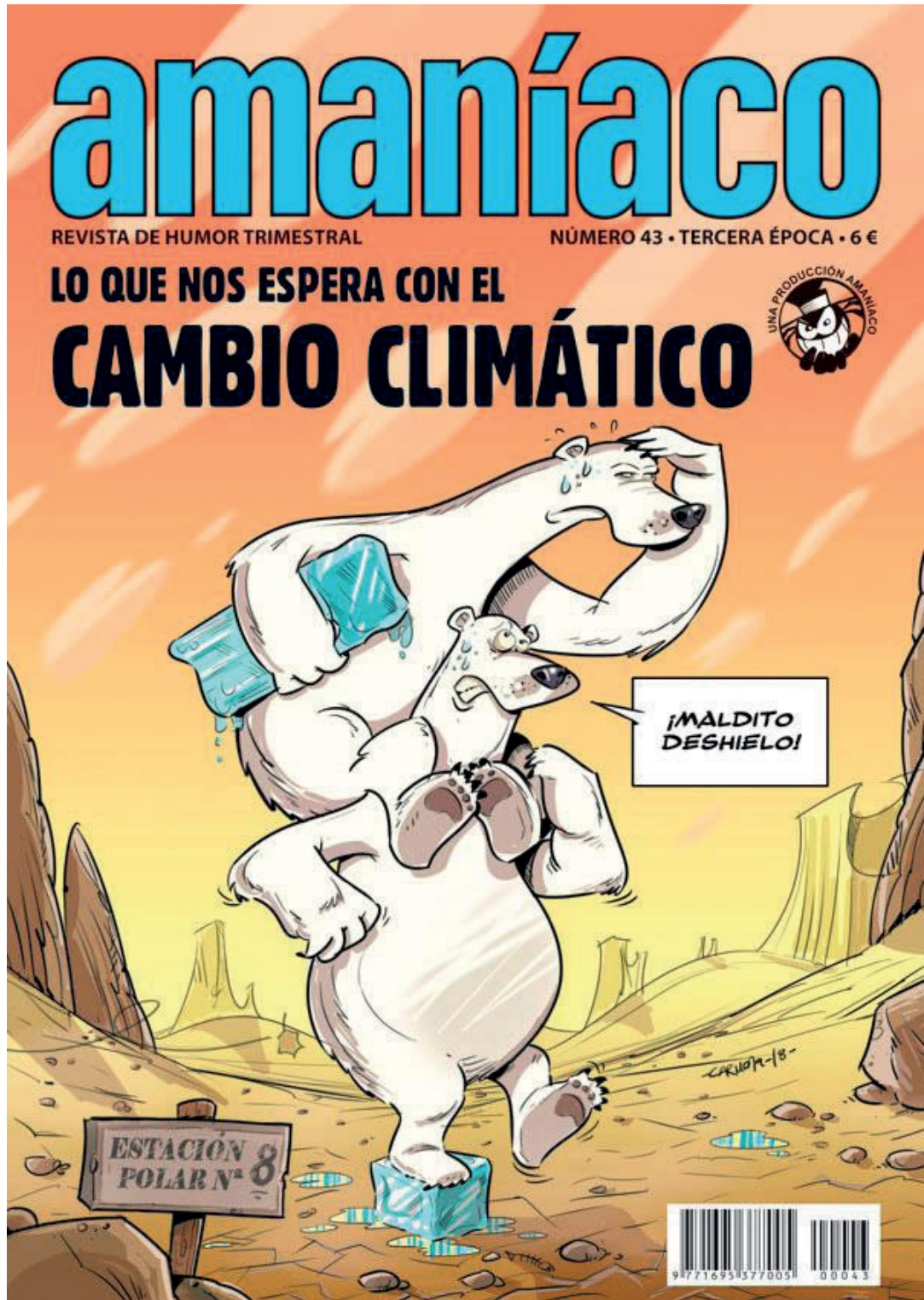
FIG. 5. Amaníaco . Lo que nos espera con el cambio climático , n.º 43, 2018, portada.