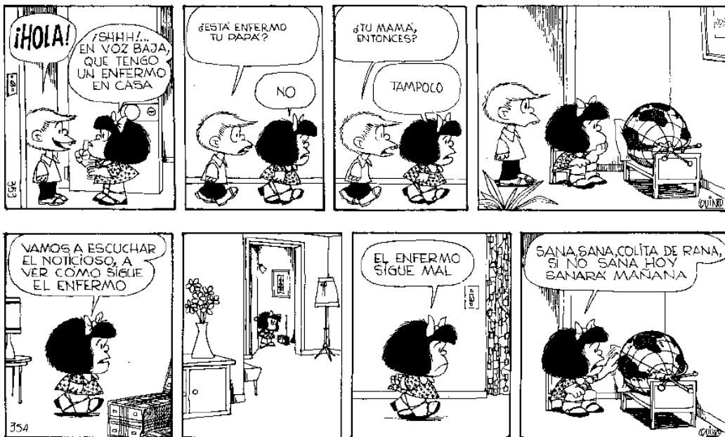
FIG. 2. QUINO. Toda Mafalda . © Ediciones de la Flor, 1993, p. 135.

preocuparnos al mostrarnos un mundo enfermo (FIG. 2), demacrado, siendo noticia continua tanto en la radio, en la prensa como en la televisión y en el apartado de desgracias y sucesos. Este mundo, que abarca todas las problemáticas que recorren cada rincón del mismo, es objeto de otras tiras como aquella en la que Mafalda le comenta a su osito de peluche que el mundo que ve (indicándole el mapamundi que le acompaña en todas estas tiras) es lindo porque es una maqueta, ya que el original es un desastre.