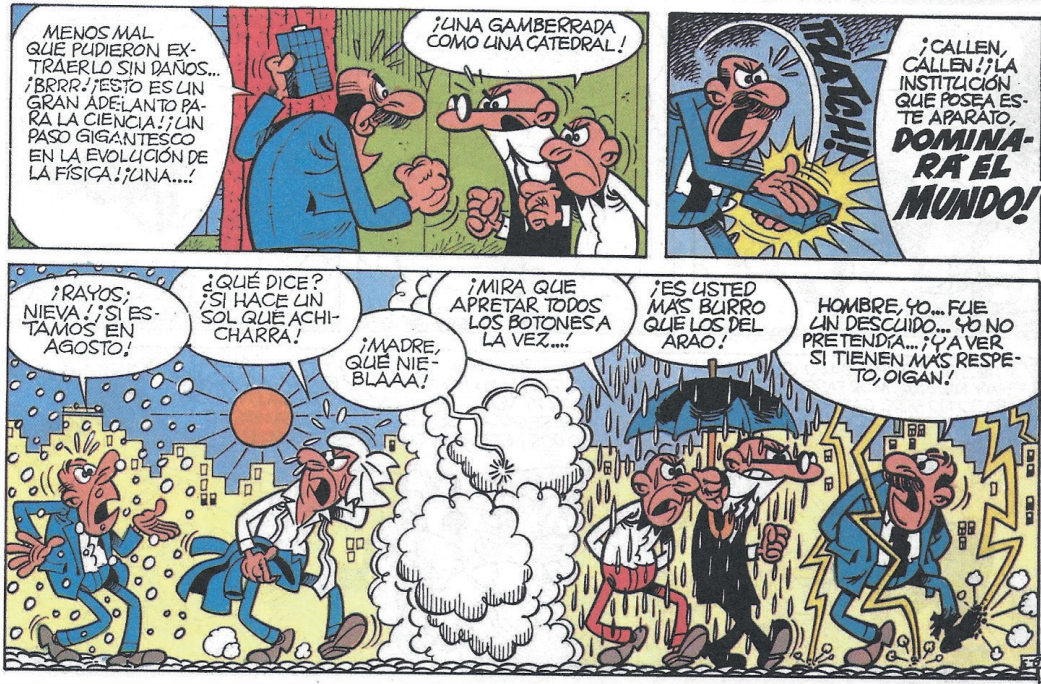
FIG. 7. IBÁÑEZ, F. Mortadelo y Filemón. El estropicio meteorológico . © Ediciones B, 1987, p. 6.

aparatosas con rayos y truenos, nieve y pedrisco, o incluso llegan a alterar las manifestaciones de la energía interior de la Tierra, como terremotos y volcanes. Este aparato trastocador se vuelve en ocasiones rebelde, dado que está en fase de pruebas, y en otras ocasiones su mal uso (como, por ejemplo, el pulsar todos sus botones a la vez), lleva a más de una situación estrambótica, donde pueden coexistir a la vez una nevada, calor extremo, niebla intensa, lluvia torrencial y rayos y truenos (FIG. 7).