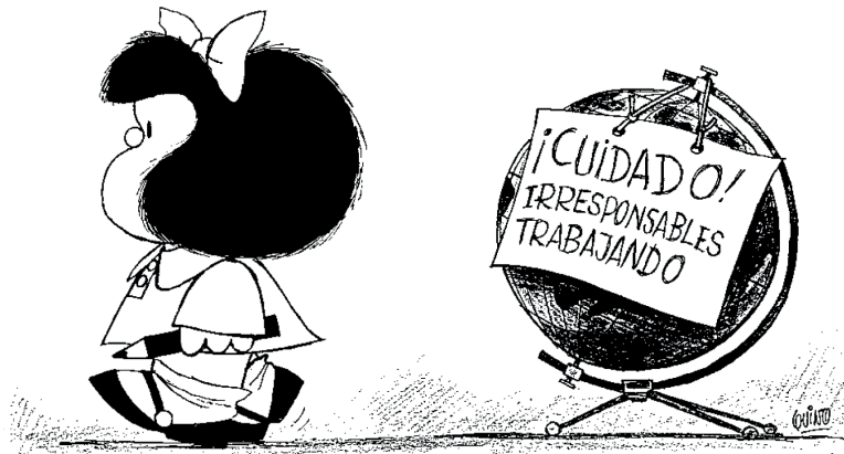
FIG. 1. QUINO. Toda Mafalda . © Ediciones de la Flor, 1993, p. 639.

preocuparnos al mostrarnos un mundo enfermo (FIG. 2), demacrado, siendo noticia continua tanto en la radio, en la prensa como en la televisión y en el apartado de desgracias y sucesos. Este mundo, que abarca todas las problemáticas que recorren cada rincón del mismo, es objeto de otras tiras como aquella en la que Mafalda le comenta a su osito de peluche que el mundo que ve (indicándole el mapamundi que le acompaña en todas estas tiras) es lindo porque es una maqueta, ya que el original es un desastre.