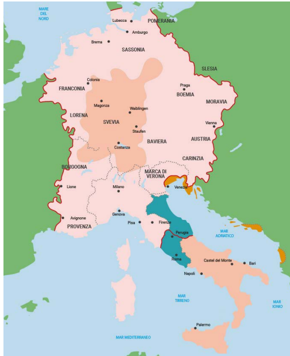
Imperio de Federico II. En color claro, los territorios feudatarios; sombreadas, las posesiones de emperador; el centro se marca en color oscuro el Patrimonio de S. Pedro.

Eran tiempos turbulentos y no faltaron personajes dispuestos a echar leña al fuego.