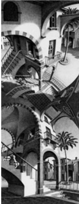
Arriba y abajo , M.C. Escher, 1947.

pueden citarse, nosotros nos detendremos en cuatro artistas de especial relieve: M. C. Escher, G. Ligeti, M. Rothko y M. Feldman. A través de su obra intentaremos aproximarnos a las distintas dimensiones que ligan, y a veces confunden, lo virtual y lo real.