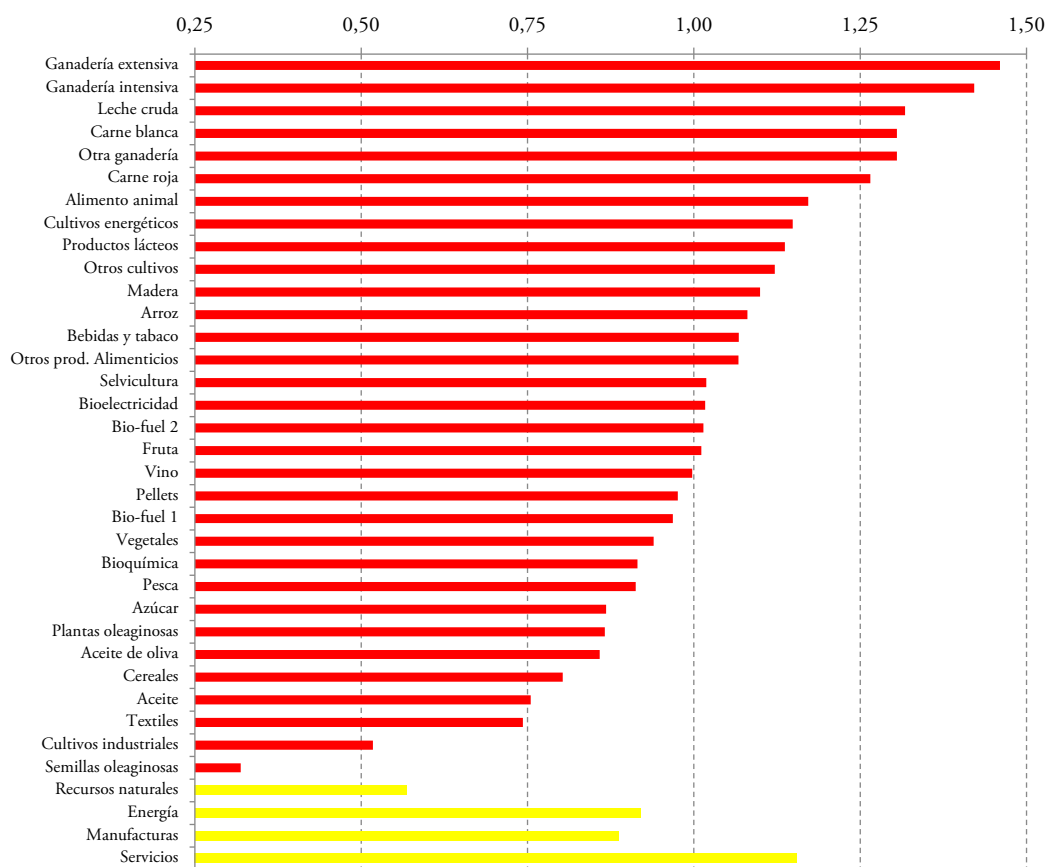
GRÁFICO 1. Backward linkage del output (valor de su multiplicador respecto a la media) de los sectores de la Bioeconomía. España, 2010

Se muestra a continuación un primer análisis de la bioeconomía en España, comparando sus principales valores con los correspondientes a los del resto de países miembros de la Unión Europea, obteniendo para ello los multiplicadores de producción y empleo descritos previamente.