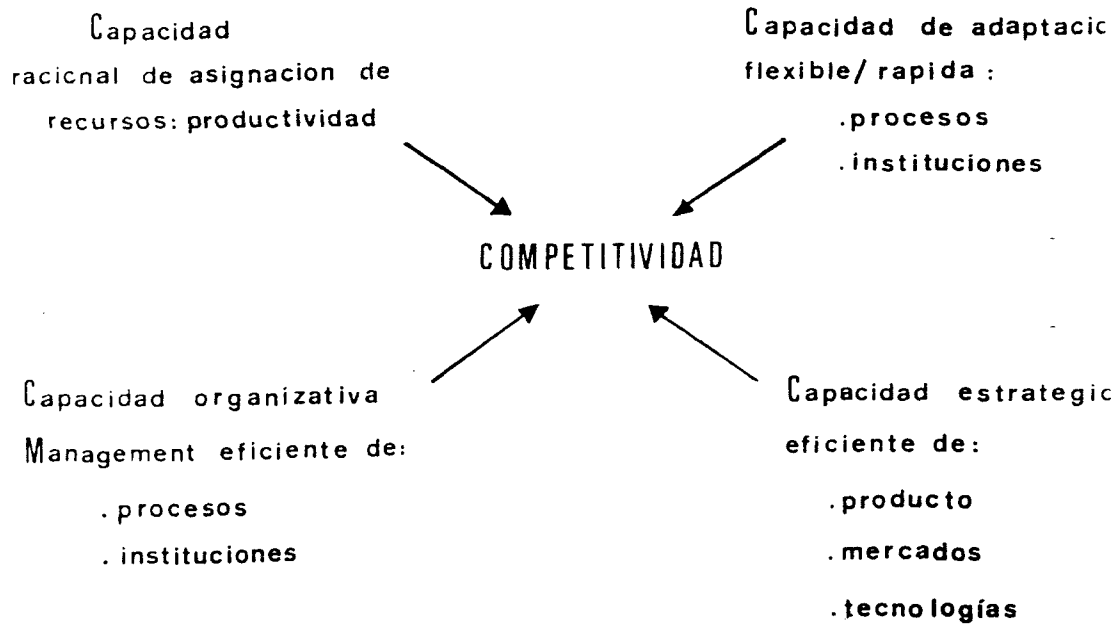
Figura núm. 3. Repercusiones de la competitividad.