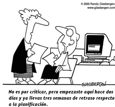
Imagen 1. Dibujo satírico sacado de un documento elaborado por la Fédération Européenne de Écoles (2011) para la Ecole Internationale Tunon (Francia) 7 .

Pasemos, entonces, a las preguntas planteadas en este artículo, a las respuestas 8 de los tres informantes seleccionados (VLR, DBR y EM) y a nuestros comentarios y reflexiones.