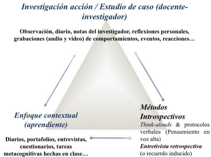
Figura 1. Triangulación en una investigación sobre el desarrollo las competencias orales (expresión y comprensión).

Mientras que el análisis de la producción (más precisamente el análisis de la interacción comunicativa) representa un procedimiento de interpretación que permite localizar los elementos y los esquemas determinados por el paradigma y el objetivo de la investigación, la entrevista retrospectiva tiene como meta la reconstrucción individual de la situación comunicativa y social, tal y como fue vivida por los propios actores. Es así como se encuentran integradas la perspectiva del docente-investigador, externa a la situación de comunicación en cuestión, los comportamientos observables y tangibles de los informantes, y las perspectivas internas de los interactuantes verbalizadas después de la actuación.