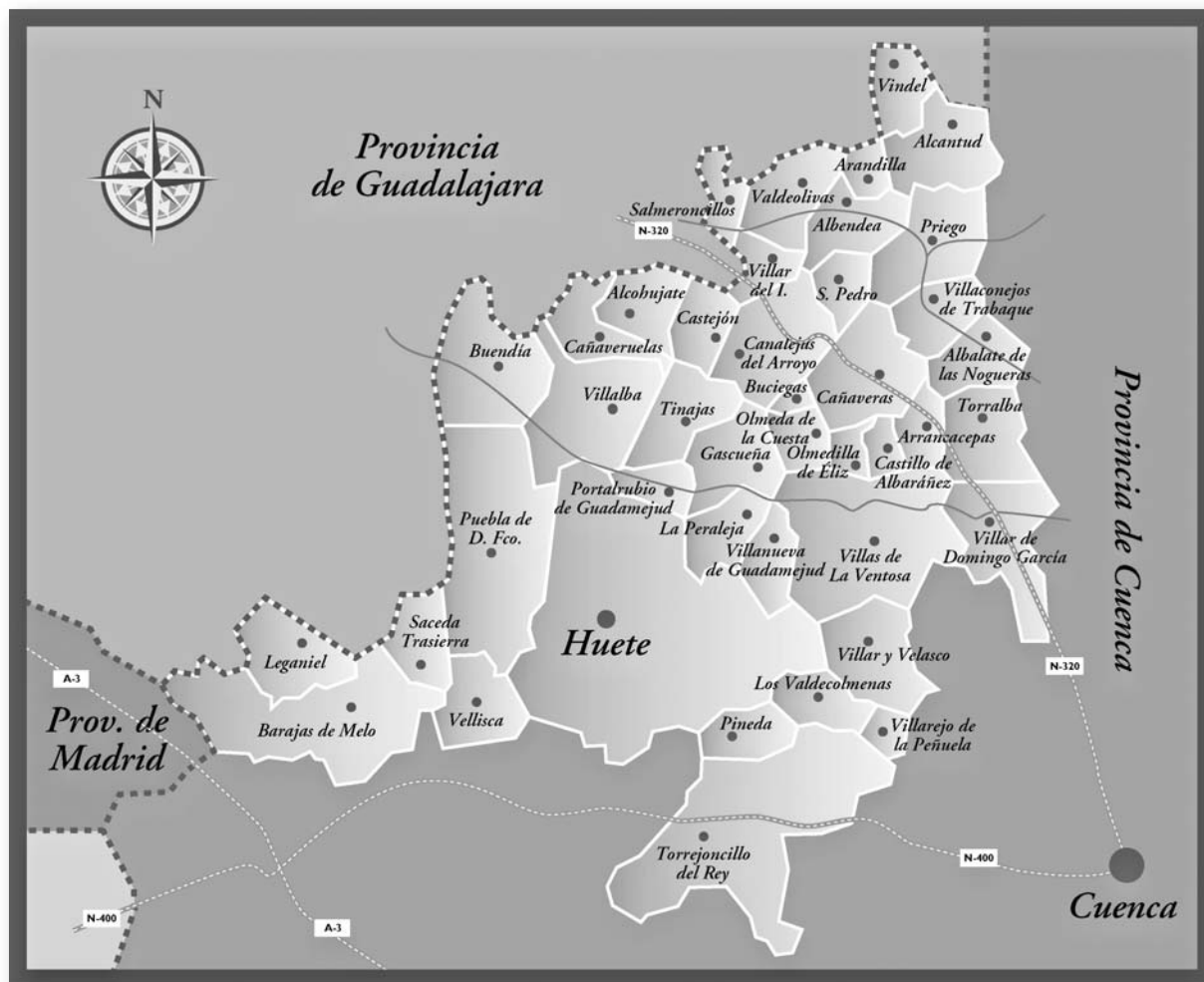
Figura 1.- Localización del área de estudio.

Según el Padrón de 2007 acogía una población de 11.641 habitantes, con una densidad media de 4,63 hab/Km 2 .