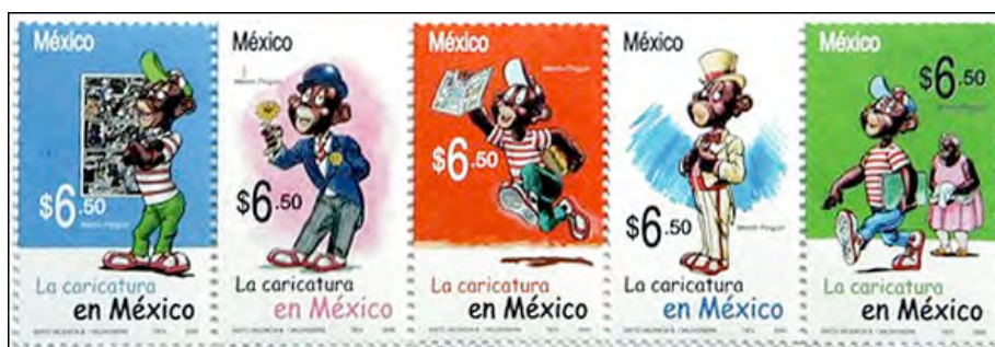
Fig. 3. Los cinco timbres postales de Memín Pinguín.

Para los dirigentes nacionales, esta multiplicidad de etnias funda la prioridad de hispanizar el país, una fundación del progreso para algunos oficiales. Observa Hernández: «El negro mexicano y sus descendientes de color quebrado salían de la colonización y entraban a la globalización. De esta manera y al mismo tiempo el criollo legitimaba su ‘derecho’ al poder ya que era el más blanco de apariencia y manejaba la lengua oficial mejor, por lo regular» (53). Se ve, entonces, como la opresión a los negros no sólo sirve para negar la existencia de los afro-mexicanos sino también invalida la cultura indígena y aun todos los que quedan fuera de lo criollo. Por ejemplo, los programas para promover la alfabetización, a veces desarrollados con la utilización de las historietas, difundieron el castellano e ignoraban los idiomas anteriores del país.