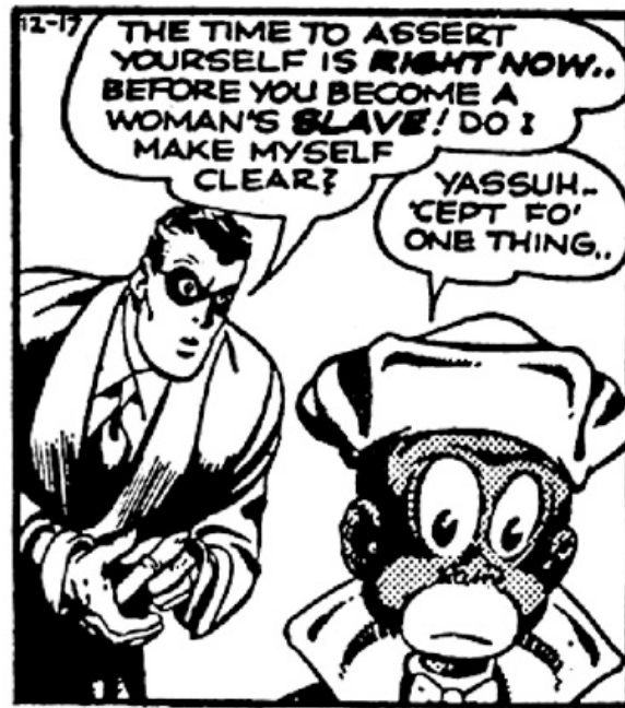
Fig. 2. Ebony White y The Spirit

Pablo Espinosa contradice la versión de Manelick de la Parra Vargas en otro artículo de La Jornada , “La negritud de Memín Pinguín se remonta a EU,” que culpa Ebony White, 1 un personaje de The Spirit , una tira cómica estadounidense creada por Will Eisner en 1940. «El parecido entre el Ebony estadounidense y el Memín Pinguín mexicano es indudable —afirma Espinosa—. El propio Sixto Valencia ha reconocido que tomó como modelo a Ebony para dibujar a Pinguín». Espinosa añade que, dado al racismo oriundo del vecino del norte, los estadounidenses no deben criticar a los mexicanos. Sin duda, la representación de Ebony White, visto en la figura 2, es parecida a la de Memín Pinguín, en la figura 3. No obstante, las semejanzas no son completamente convincentes. Ambos muestran los labios grandes y blancos, los ojos muy abiertos, y la nariz chata pero tales rasgos forman los estereotipos de otros muchos personajes anteriores de las películas hollywoodenses hasta incluso los participantes en las actuaciones minstrales del siglo XIX. Después de los debates de las estampillas, las descripciones de Memín —alabándolo por entrañable o recriminándolo como icono del racismo— abundan por todas partes. «Durante los años de existencia de esa historieta, en México nadie se ha sentido ofendido, inclusive es un personaje muy querido —insiste Elena Poniatowska— No entiendo por qué ahora se desata esto. ¿Por qué en