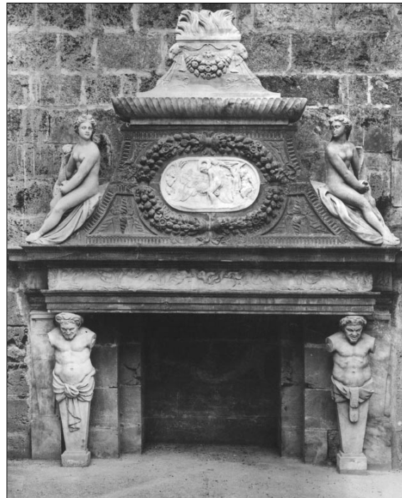
3. Gio. Giacomo della Porta y taller. Chimenea de Leda . Palacio de Carlos V. Granada. 1536-38.