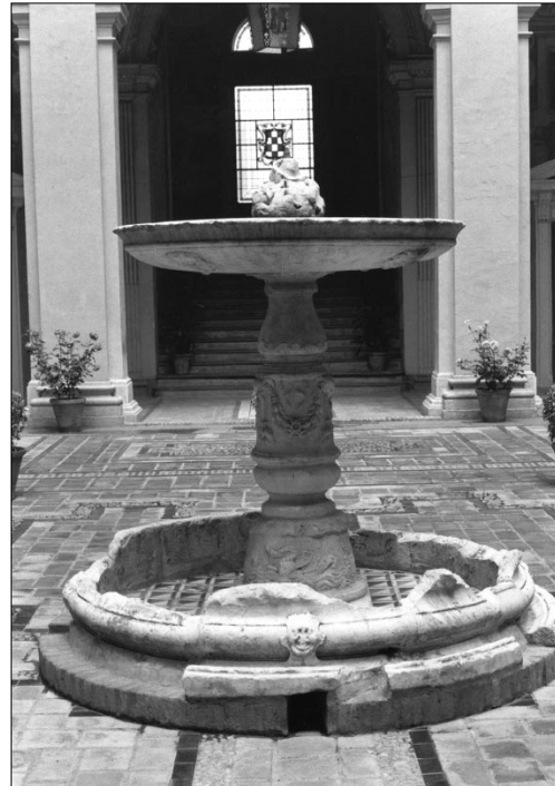
2. Gio. Giacomo della Porta y taller. Fuente del palacio del Viso (Archivo General de Marina) . El Viso del Marqués (Ciudad Real). 1536-38