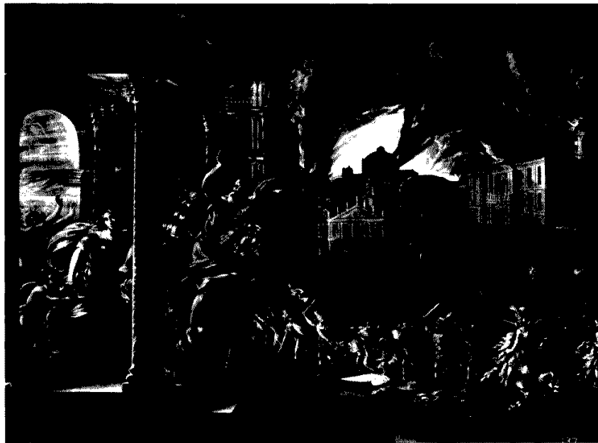
Fig. 7. — J. RIBERA: Laocöon , Roma, Gabinetto Nazionale delle Stampe. Fig. 8. — J. DE LA CORTE: Incendio de Troya , Madrid, Museo del Prado