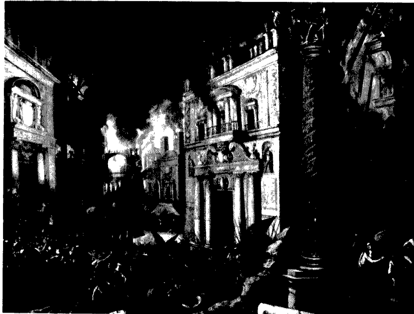
Fig. 9.—J. DE LA CORTE: Incendio de Troya . Madrid. Museo del Prado. Fig. 10.—F. CO- LONNES: Incendio de Troya . Madrid. Museo del Prado