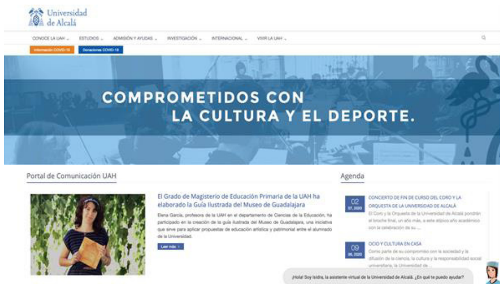
FIGURA 1. PUBLICACIÓN DE NOTICIAS DE LA HERRAMIENTA O GUÍA DIDÁCTICA POR INTERNET (PORTAL DE COMUNICACIÓN UAH, 2020).