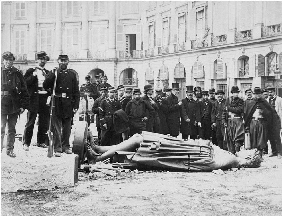
Fotografía de la Comuna de París.

La guerra franco-prusiana provocó la caída del Segundo Imperio, y la proclamación en 1870 de la Tercera República en Francia. Poco después, en 1871, se instauró la Comuna de París, la cual fue finalmente suprimida. En este nuevo periodo republicano se aprobaron reformas importantes, como la implantación de la enseñanza obligatoria gratuita, y la separación entre Iglesia y Estado. El proceso de industrialización continuó desarrollándose, así como la expansión colonial.