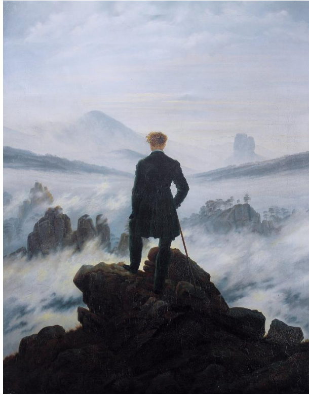
Caminante sobre un mar de niebla (1819), de Caspar David Friedrich.