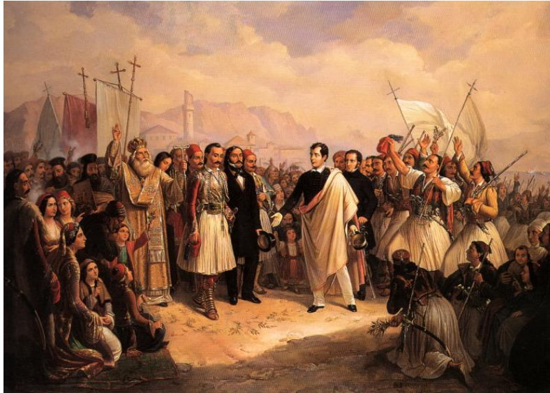
La recepción de Lord Byron en Mesolongi, durante la guerra de independencia de Grecia, por Theodoros Vryzakis.