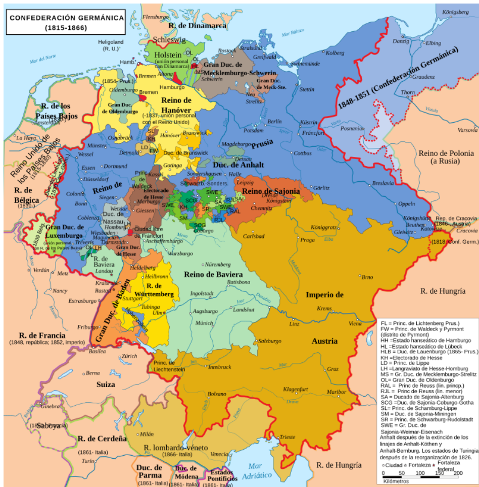
Situación de los territorios germánicos antes de la unificación alemana.