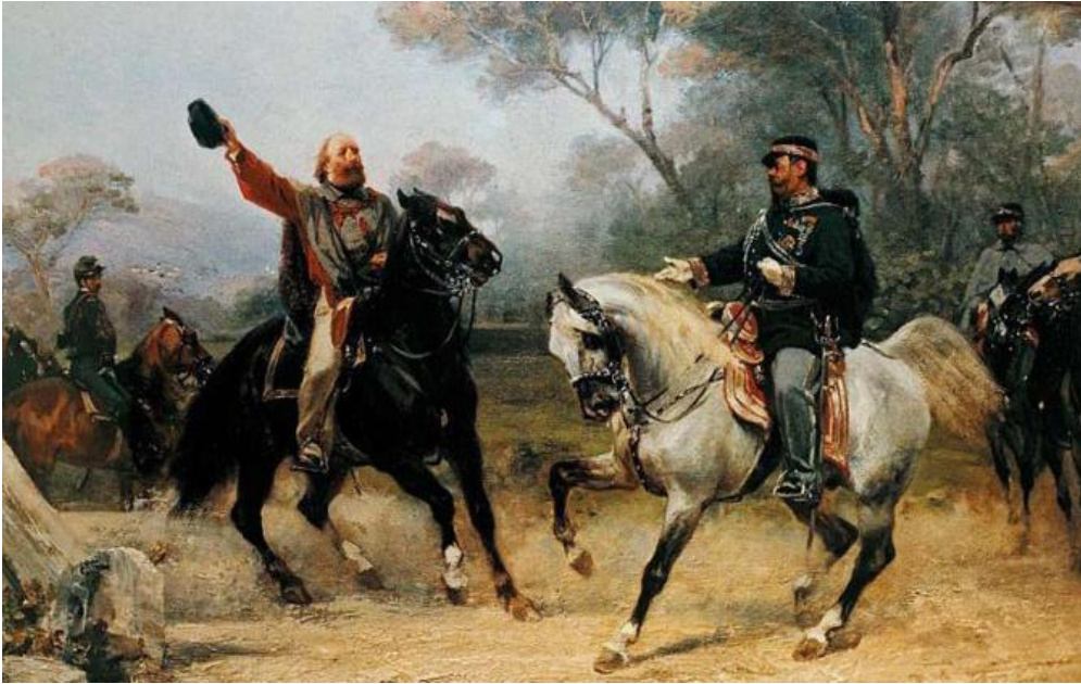
Encuentro entre Garibaldi y Víctor Manuel II.