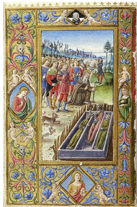
ILUSTRACIÓN 30. PML MS M.14, f. 130v