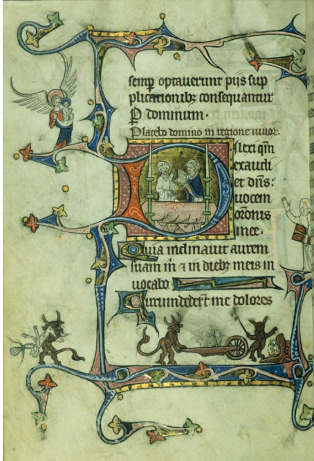
ILUSTRACIÓN 3. WAM W.90 194v