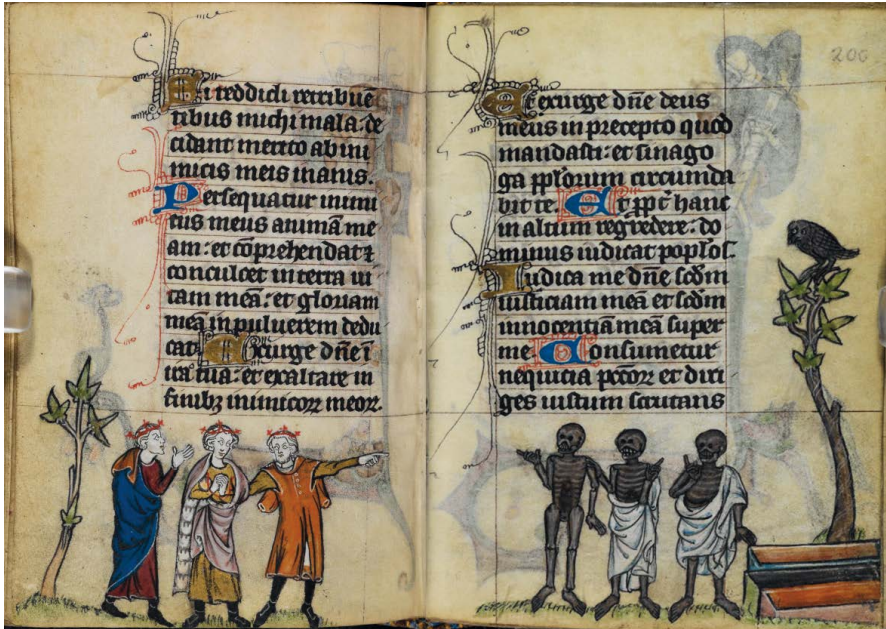
ILUSTRACIÓN 28. BL Stowe MS 17, ff. 199v-200r