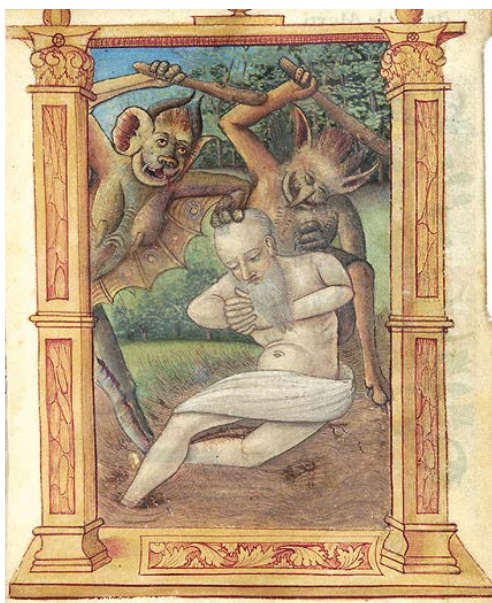
ILUSTRACIÓN 17. PML MS M.510, f. 98r