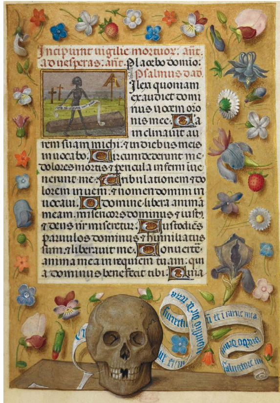
34. BL Add MS 38126, f. 151r

La importancia del vínculo texto-imagen, así como su interdependencia en los libros litúrgicos resulta innegable. En palabras de Mâle (1910 [1898]: 34), «les artistes furent aussi habiles que les théologiens à spiritualiser la matière: ils curent des inventions dont quelques-unes furent ingénieuses, d'autres touchantes, d'autres grandioses». Así, en este artículo hemos querido elaborar un primer listado de motivos que acompañan al Oficio y a las plegarias de difuntos insertos en los libros de horas manuscritos, empresa que deberá ampliarse en próximos trabajos con el fin de completar el panorama del imaginario asociado a estas oraciones. Por ahora solo se puede apreciar el caudal de imágenes que, en una segunda etapa, permitirá desbrozar la influencia de la sociedad y de sus gustos, así como las inquietudes religiosas y otras preocupaciones vitales de los poseedores de estos libros, sin olvidar la importancia del proceso creativo de estos singulares manuscritos difundidos durante la Baja Edad Media.