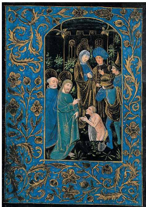
ILUSTRACIÓN 14. PML MS M.493, f. 93v