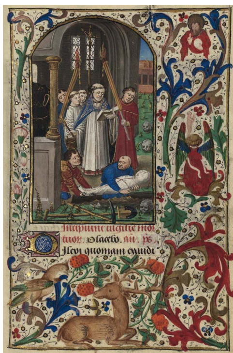
ILUSTRACIÓN 9. BNE Vitr. 24/10, f. 124r

A menudo, estos motivos se representan en medallones o pequeñas viñetas acompañando a la imagen principal (Bibliothèque de l’Arsenal Ms-1196 réserve, f. 133r [il. 10]; BL Add MS 18850, f. 120r [il. 11]; BL Egerton MS 2019, f. 142r [il. 12]; PML MS M.1175, 124v; PML MS M.359, ff. 119v-123v; BnF Latin 1176, f. 140v).