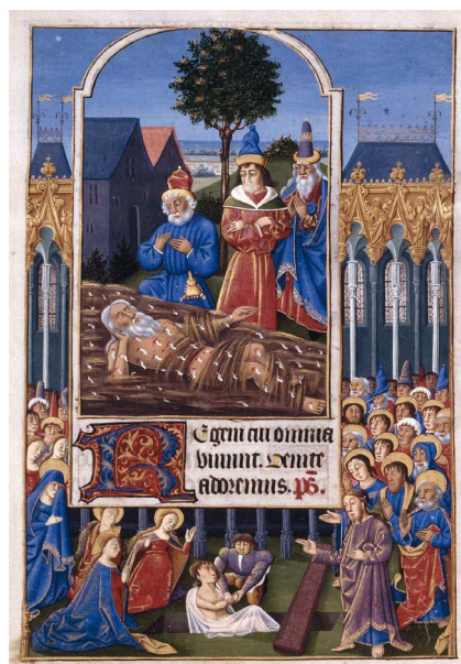
ILUSTRACIÓN 18. BNE Vitr. 25/3, f. 143v