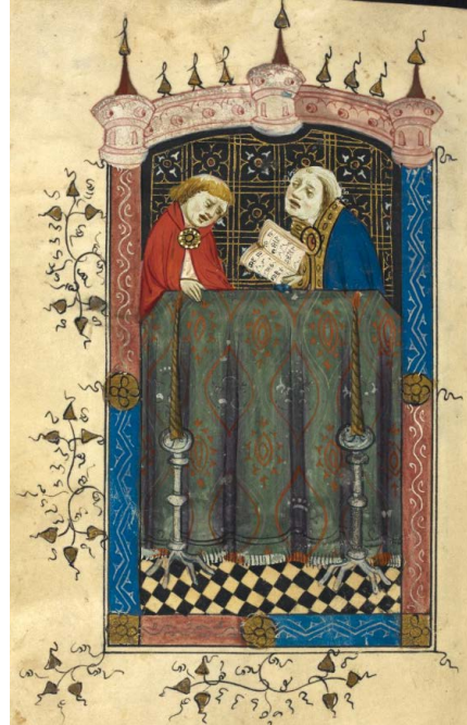
ILUSTRACIÓN 4. BL Sloane MS 2683, 82v