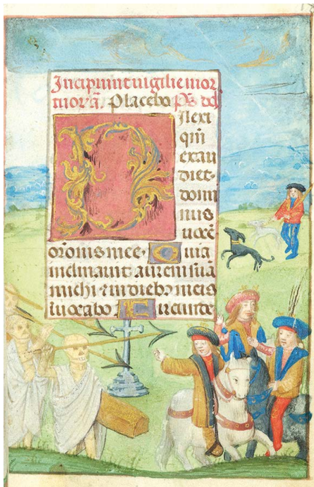
ILUSTRACIÓN 29. PML MS S.7, f. 183r