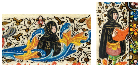
ILUSTRACIÓN 32. PML MS M.357, f. 118v (detalles)

7) En general, la ornamentación de los márgenes y las orlas no presenta decoraciones relativas a la muerte: en contados casos pequeñas imágenes representan ángeles, santos, figuras encapuchadas y afligidas (PML MS M.357, f. 118v). Es posible notar un cambio de tendencia a partir de la segunda mitad del siglo xv, fruto del aumento de motivos macabros como calaveras, esqueletos y huesos, además de esquelas mortuorias y rótulos con inscripciones funerarias (BL Add MS 50002, f. 85r [il. 25]; BnF NAL 3210, f. 76v [il. 27]; WAM W.420 [il. 33], f. 120v; BL Add MS 38126, f. 151r [il. 34]; PML MS M.80, ff. 109r, 112v, 121r, 124v, 126v, 142v; WAM 427, ff. 164-165r).