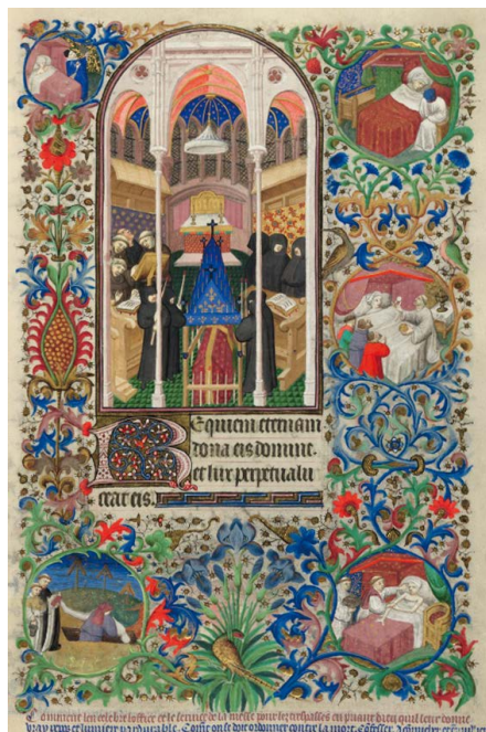
ILUSTRACIÓN 11. BL Add MS 18850, f. 120r