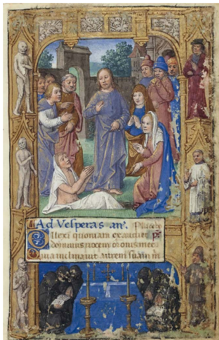
ILUSTRACIÓN 15. BnF Latin 3120, f. 102r