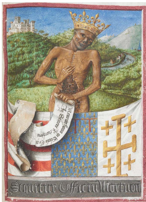
ILUSTRACIÓN 23. BL Egerton MS 1070, f. 53r

6) La personificación de la Muerte es otro tópico muy significativo: triunfante con corona (BL Egerton MS 1070, f. 53r [il. 23]), montada en un buey (BNE Vitr. 22/2, f. 104r; BnF NAL 3191, f. 100v [il. 24]) o como jinete ecuestre (BL Egerton MS 2019, f. 142r [il. 12]; PML MS M.854, f. 161v), volando (BL Yates Thompson MS 30, f. 83r), con guadaña (BL Add MS 50002, f. 85r [il. 25]), flecha única sin aljaba, quizá como el anverso de las de cupido (PML MS M.1160, f. 105r), lanza/as (BNL IL-1, f. 112v) o espejo (WAM W.431, f. 115r [il. 26]); persiguiendo a jóvenes o a doncellas (PML MS S.5, f. 144r; BnF NAL 3210,