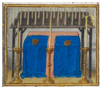
ILUSTRACIÓN 2. BL Add MS 38126, f. 179r