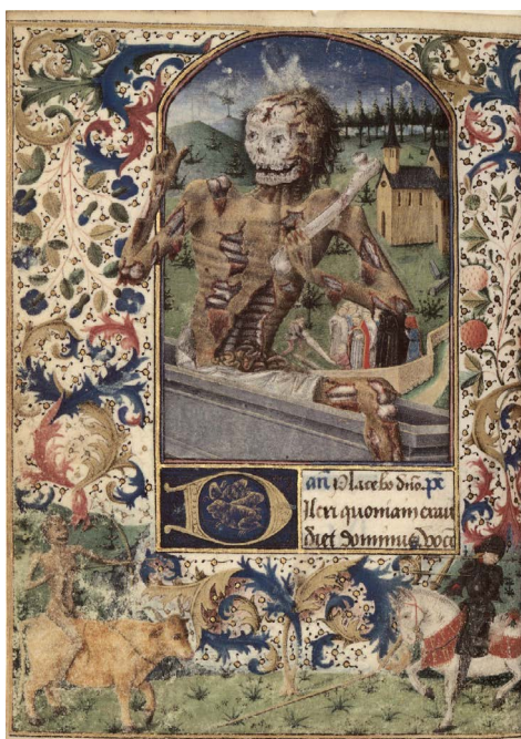
ILUSTRACIÓN 24. BnF NAL 3191, f. 100v