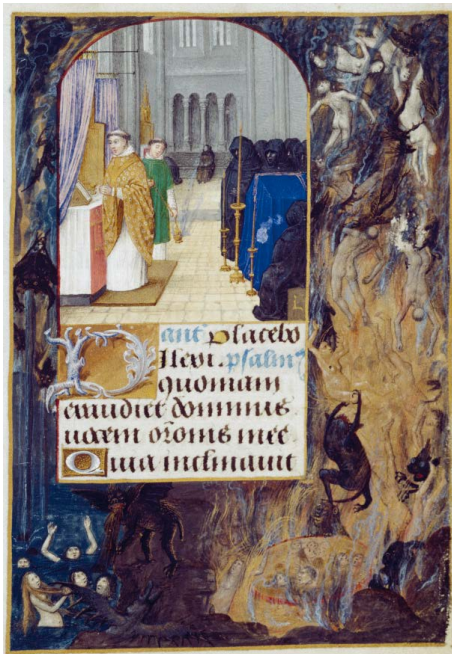
ILUSTRACIÓN 5. BNE Vitr. 25/5, f. 238r