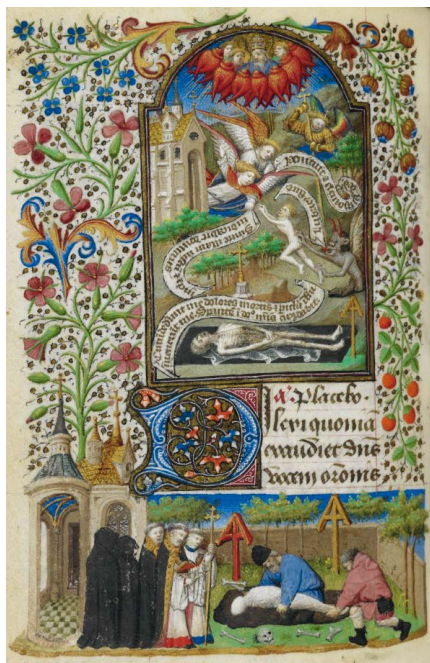
ILUSTRACIÓN 13. BL Yates Thompson MS 3, 201v

4) La resurrección de Lázaro (ejs. PML MS M.493, f. 93v [il. 14]; WAM W.435, 128v; BnF Latin 3120, f. 102r [il. 15]) y la postración de Job en el muladar (BnF Latin 1374, f. 108v [il. 16]) son los siguientes episodios más representados, en particular a partir de mediados del siglo xv. En la mayoría de estos ejemplos se plasma el tema principal de la narración, pero no