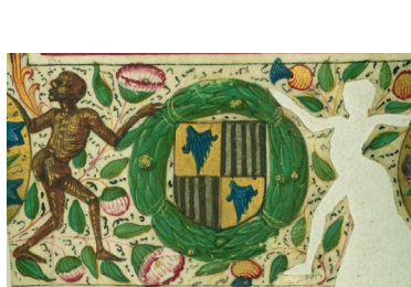
ILUSTRACIÓN 33. WAM W.420, f. 120v