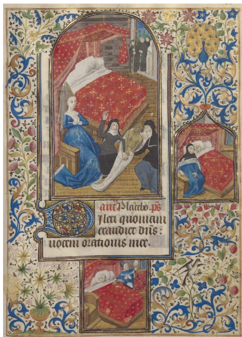
ILUSTRACIÓN 10. Bibliothèque de l' Arsenal Ms-1196 réserve, f. 133r