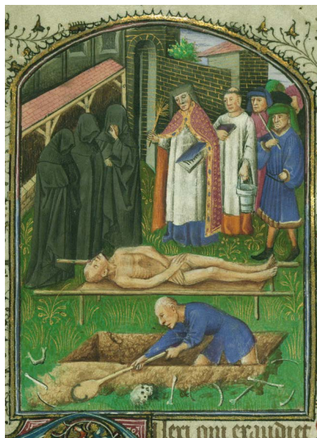
ILUSTRACIÓN 8. WAM W.262, f. 90r

3) La escena funeraria más representada corresponde al entierro, en múltiples variantes –en su mayoría sin ataúd– y con diverso número de participantes en el acto fúnebre (WAM W.262, f. 90r [il. 8]; BNE Vitr. 24/10, f. 124r [il. 9]; BL Harley MS 2900, f. 179r; BL Add MS 27697, f. 194r; BnF Latin 1161, 212v). Wieck (1999) señala que es posible trazar un recorrido visual por el ritual de la muerte: desde el diagnóstico de la enfermedad por un físico, la última confesión, la comunión y la extremaunción del moribundo por parte de la autoridad religiosa, la preparación del cuerpo por mujeres y