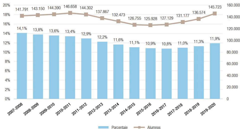
Gráfico 1. Alumnado extranjero en enseñanzas de régimen general