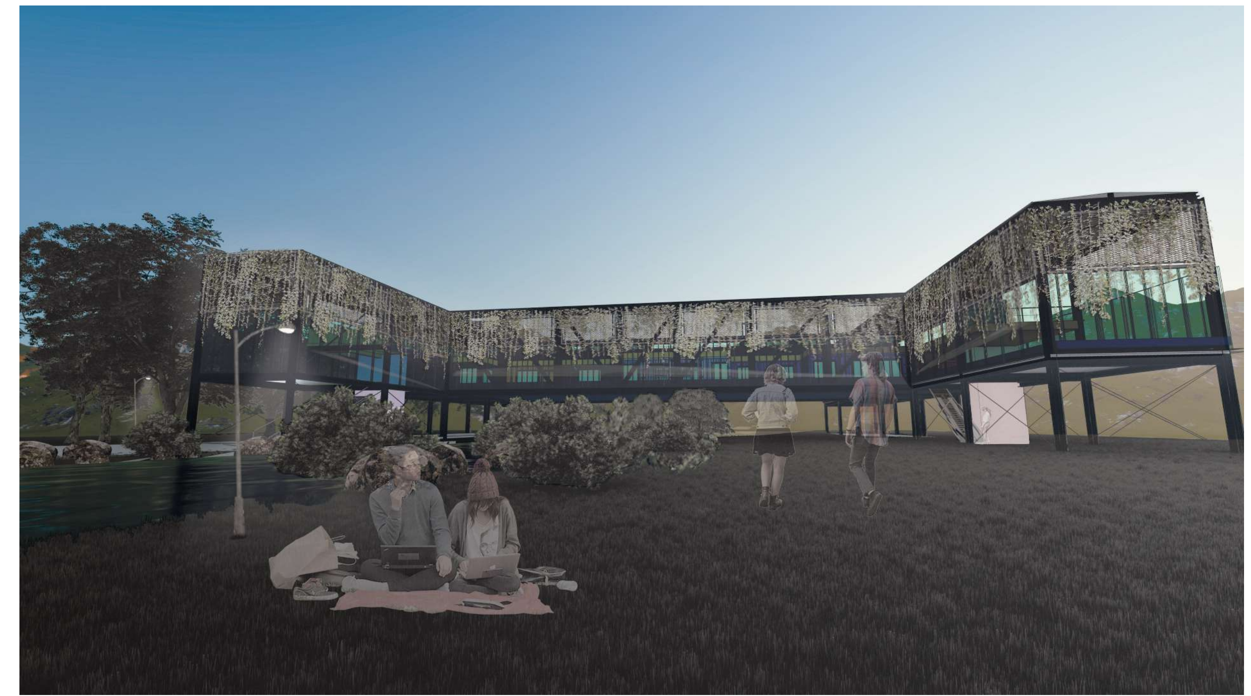
Imagen exterior río-ribera, vista B.