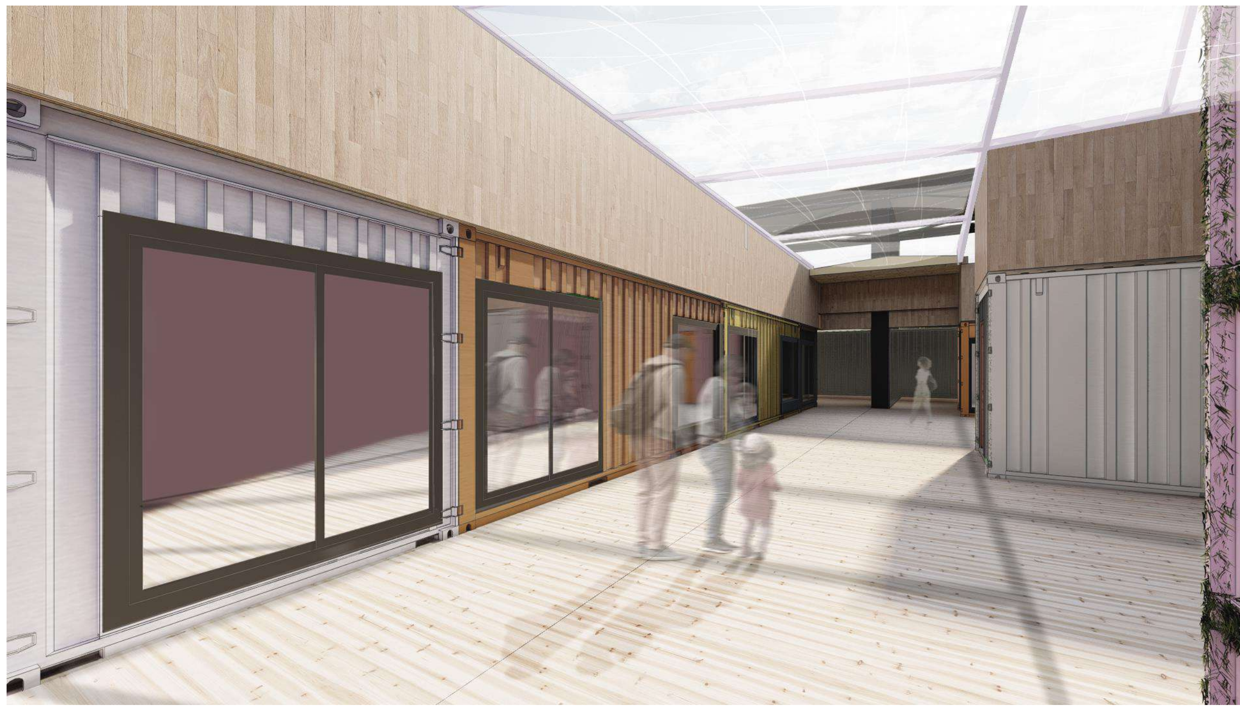
Vista desde la primera planta hacia la planta superior, vista A.