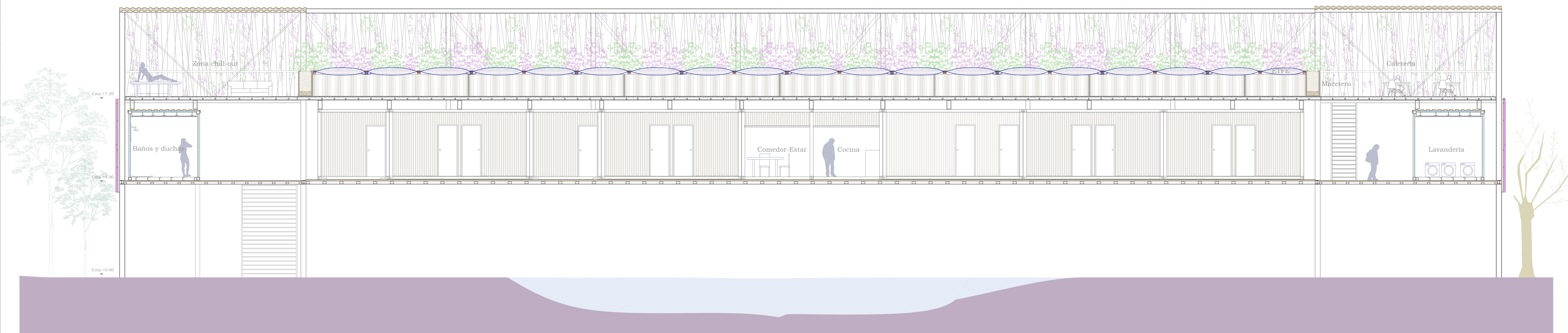
Sección longitudinal HH E: 1/80