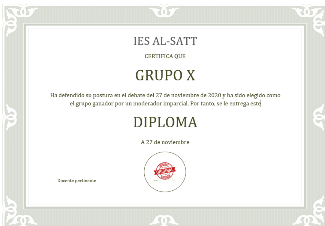
LÁMINA PARA GRUPO GANADOR DEL DEBATE: