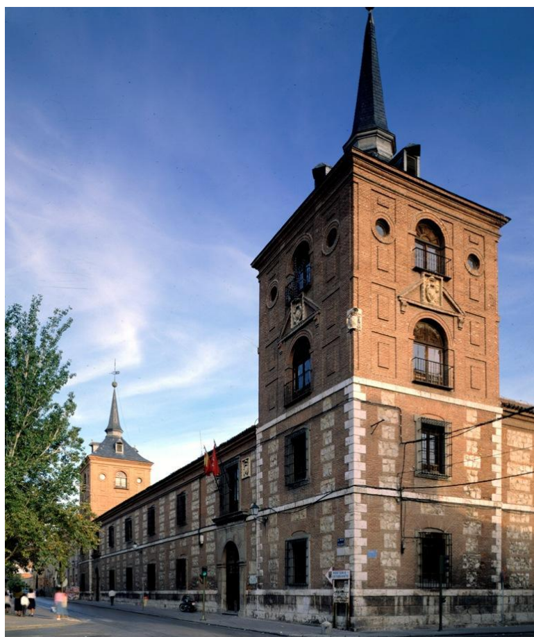
Colegio de San Ciriaco o Santa Paula "Málaga", Facultad de Filosofía y Letras, UAH