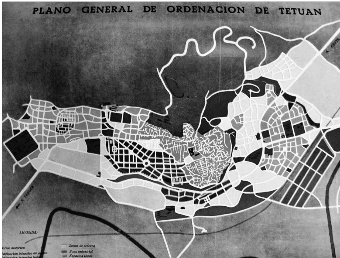
1. Plano general de ordenación de Tetuán. RNA, nº 26, 1944

como demuestra el citado historiador 9 , y de las circunstancias políticas de los años en que Muguruza Otaño actuó en el norte de Marruecos, sigamos de la mano del mismo Bravo Nieto el papel que le corresponde a nuestro protagonista en la ordenación urbanística de la ciudad de Tetuán.