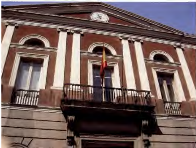
Figura 2. Fachada principal de la Universidad Central de Madrid, en la calle de San Bernardo. Foto Santiago Aragón, 2009.