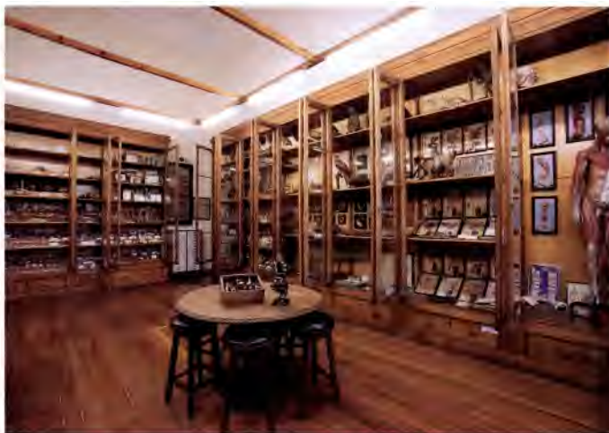
Figura 3. Vista general de una de las salas del gabinete de Historia natural del Instituto Cardenal Cisneros, Foto CEIMES.

dio de las Ciencias en todas las universidades. Ganó la cátedra de Mineralogía y Zoología de la Universidad de Barcelona, si bien renunció a ella, por no abandonar el cuidado de sus padres de avanzada edad y salud precaria (lo que explica que en su hoja de servicios sólo figure diez días en dicho destino).