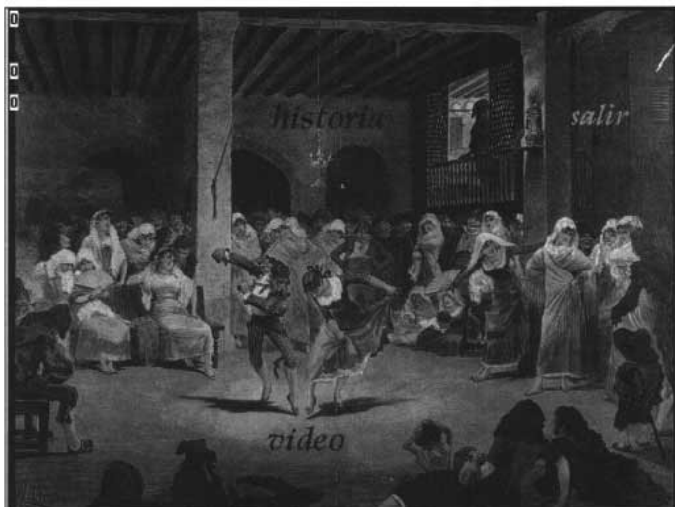
Imagen de la pantalla inicial de la aplicación.

Cuando el usuario inicia la aplicación accede a un menú sobre un fondo con una imagen del siglo XVIII que representa una escena de la época en la que se interpreta El Bolero . En este punto el usuario puede seleccionar entre ver el vídeo del baile y leer la historia de El Bolero .