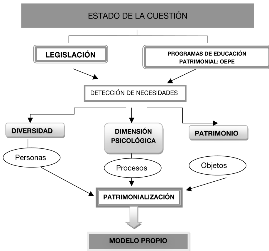
Figura 3: Esquema general de la investigación. Autor: Sofía Marín Cepeda.

En definitiva, nuestra investigación se diseña para contribuir a aportar directrices para la acción educativa, describiendo la complejidad de las situaciones conocidas y estableciendo los marcos conceptuales en que se sustentan.