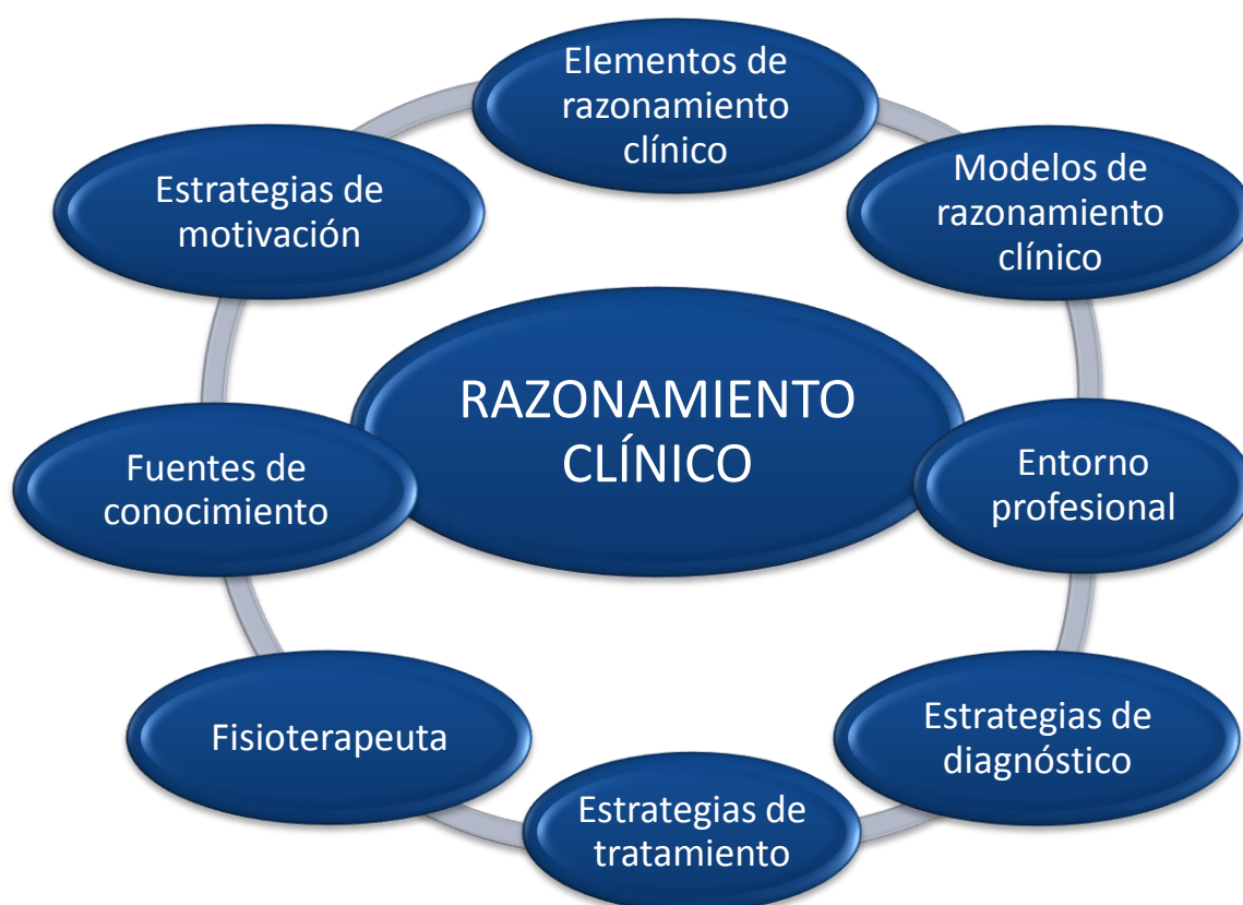
Figura 4.3. Familias identificadas tras el análisis de los datos.

La Figura 4.3 representa las 8 familias que fueron identificadas. En el centro de todas ellas se encuentra el razonamiento clínico ; la interpretación de los participantes acerca del razonamiento clínico y la importancia que le dan en su profesión se ha considerado importante destacar en el estudio.