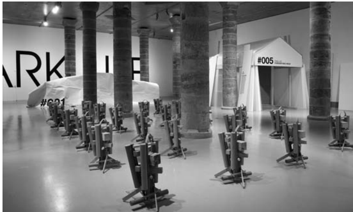
Figura 3: Exposición Park Life de Martí Guixé. Centro de Arte la Panera Lleida, 2009.

Mientras los veintiocho estudiantes de magisterio estaban realizando esta primera propuesta de trabajo, catorce de ellos inician el prácticum en la escuela Príncipe de Viana. Al mismo tiempo el Centro de Arte la Panera inaugura la primera exposición del curso 2009-2010, Park Life del artista Martí Guixé (Figura 3) y la escuela decide visitarla con todos sus alumnos. Éste es el inicio del proyecto de escuela que se desarrolla durante este curso. De todas las obras que había en Park Life , la que más impactó a los alumnos de primaria fue Burn-me piece . Tal y como se observan en la imagen son haces de leña hechos de diversos tipos de madera y diferentes formas y tamaños especialmente diseñados para ser quemados. A muchos de los alumnos les recordaba los cartuchos de fuegos artificiales.