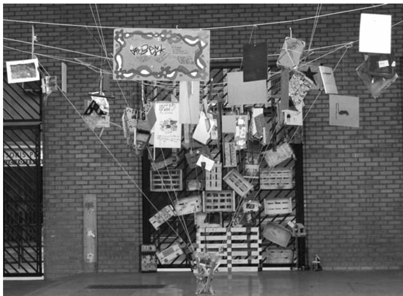
Figura 8: Escultura creada con el proyecto «fustetes».

Las estudiantes que estaban realizando el prácticum en la escuela organizaron una visita para que todos los estudiantes en formación y los profesores de maestros pudiéramos ver la escultura y trabajar sobre ella. Es como si finalizáramos tal y como iniciamos el proceso «las producciones creativas y artísticas de los alumnos» en un bucle recursivo organizativo. Un alumno de 6º de primaria de la escuela ilustró esta idea con un comentario en la visita a la Fundación Sorigué: «ahora hago una relación, comenzamos con Martí Guixé, hicimos nuestras maderas, nuestra escultura y ahora venimos aquí y vemos otras maderas, otra escultura de Gustavo Marrone». Estas palabras definen nuestro proyecto « Educ-arte - Educa (t) t »: espacio híbrido .