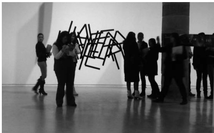
Figura 4: Visita de los estudiantes a la exposición Voz entre líneas , Centro de Arte la Panera, 2010.

«Arcángel», (2003). En éste el espectador se convierte en protagonista ya que el artista consigue que parezca que sean sus propias manos las que son leídas. Simultáneamente Javier Codesal participó en Zona Baixa con otro de los videos del proyecto «Arcángel», (2003), Lectura de Ibn Guzmán (2002). En esta ocasión, la obra relata el momento en el que una mujer de origen marroquí y un hombre de origen español intentan traducir un poema de Ibn Quzmán escrito en árabe hispanomusulmán. La dificultad de la lectura emerge de la relación de la pareja en el acto de traducir. Una experiencia que como decían los alumnos muchas veces se produce en las tutorías de las escuelas, cuando los padres no dominan el idioma, ya sea el catalán o castellano. La experiencia se completa unos meses más tarde cuando tuvimos la oportunidad de encontramos con Javier Codesal y profundizamos sobre la importancia de la interacción y el lenguaje para mejorar los procesos de humanización. Una de las alumnas explicaba: