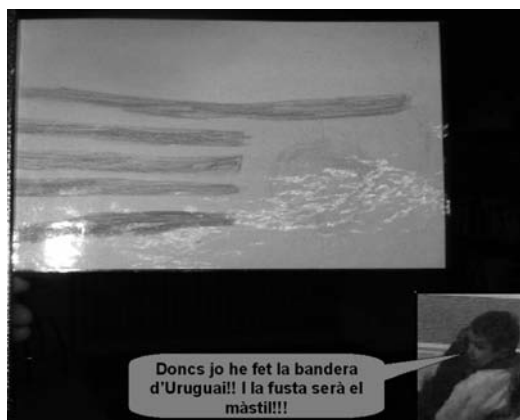
Figura 5: Producción de niños de 8 años de la escuela en el marco del proyecto «fustetes».

la voz de los alumnos observan que quieren personalizar la madera en función de criterios muy distintos (Figura 5).