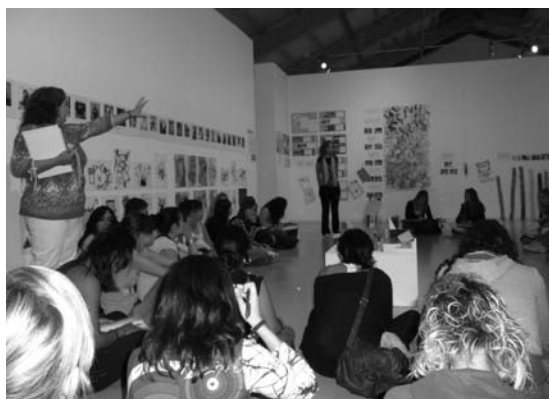
Figura 2: Visita de los alumnos de la Facultad a la muestra de Jornadas de Puertas Abiertas del Centro de Arte la Panera.

Durante la visita en el Centro de Arte observamos, conversamos sobre las obras, realizamos hipótesis sobre cómo se llegó a concretar esta propuesta en la escuela (Figura