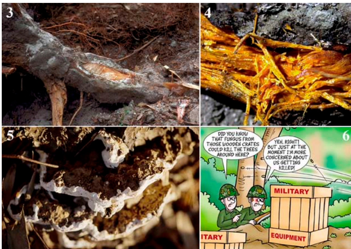
Figs. 3-4. Raíces de un pino parasitado por Heterobasidium annosum (Fr.) Bref.. Fig. 5. Basidiocarpos de H. annosum. Fig. 6. Viñeta humorística publicada en The Lancet (agosto, 2005) en un artículo sobre el tema.

annosum en palés y cajones de madera empleados para transportar equipamiento militar, que estuvieran fabricados con madera de árboles infectados (GONTHIER & al. , 2004) (Fig. 6).